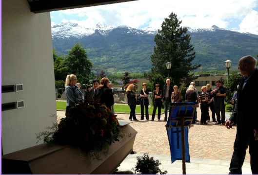
Beerdigung in Vaduz 2013

Unsere lieben Verstorbenen ruhen im Schutze der liechtensteinischen Kommunalfriedhöfe. Die Orthodoxen Christen schätzen sehr die Sympathie der Einheimischen ohne konfessionellen Unterschied, und wollen keine getrennten Friedhöfe.