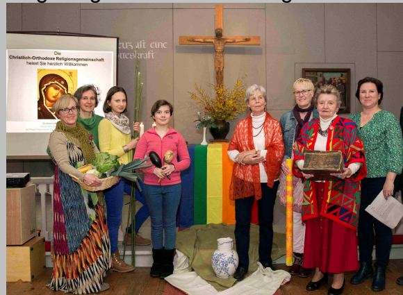
Zu Gast in unserer Kirche (2016 Vaduz)