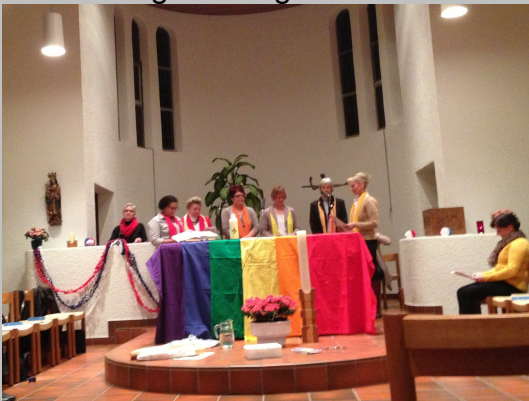
Orthodoxe, evangelische, lutherische und katholische Frauen organisieren die Veranstaltung (2013 Schaan)

Die Orthodoxe Kirche leistet ihren Beitrag am kulturellen und kirchlichen Leben. Beim Weltgebetstag 2016 war die orthodoxe Religionsgemeinschaft Gastgeberin