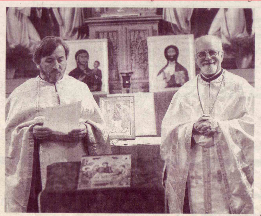
Gründung der ACK Liechtenstein 1997

Die Christlich-Orthodoxe Religionsgemeinschaft engagiert sich seit Jahrzehnten für ein harmonisches Zusammenleben in der gesamten Gesellschaft. Drum haben viele unserer Initiativen einen allgemeinnützigen Charakter, der auch in der Öffentlichkeit Anerkennung findet.