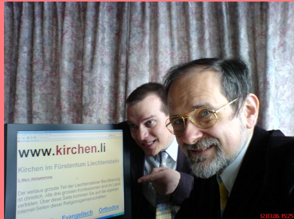
Interkonnektionelle Internetpräsenz 2006